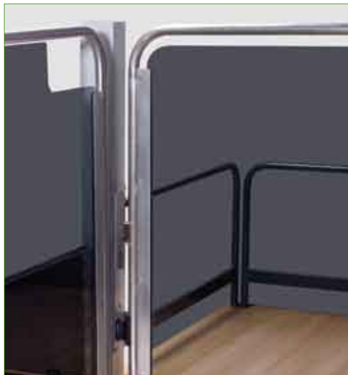
Version con cancela con cristal

No necesita ningún tipo de foso, por lo que su instalación se realiza verdaderamente a la medida de las estructuras preexistentes.