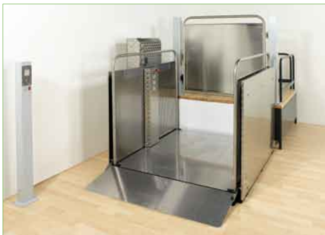
Versión con desembarque rectilíneo

La cerradura eléctrica controla el apertura de la cancela cuando la peana llega al piso de arriba